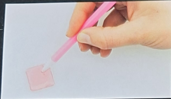
riempi la punta con la cera! fill the tip with wax