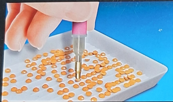
Utilizza la punta dell'applicatore per premere delicatamente sulla sommità della gemma e raccoglierla. Use the crystal applicator tip to gently press on the top of jewel and pick up jewel.