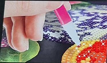
IT: Applica le gemme sull'adesivo seguendo le lettere. GB: Apply the gems on the adhesive surface following the letters. ES: Aplica las gemas en la pegatina siguiendo las letras.